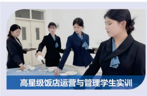
高星级酒店运营与管理学生实训