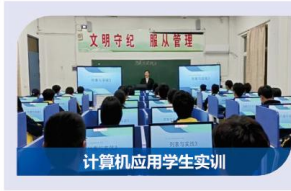
计算机应用学生实训