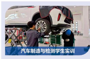
汽车制造与检测学生实训