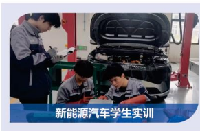
新能源汽车学生实训