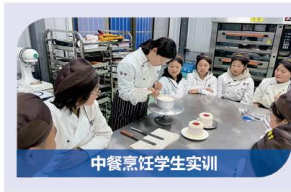
中餐烹饪学生实训