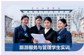
旅游服务与管理学生实训