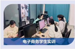
电子商务学生实训