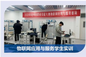
物联网应用与服务学生实训