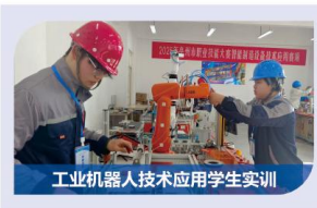
工业机器人技术应用学生实训