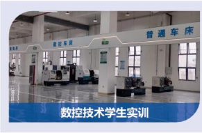
数控技术学生实训