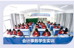
会计事务学生实训