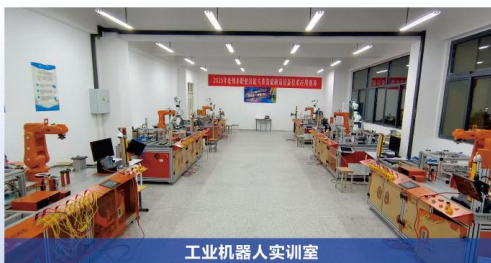
工业机器人实训室